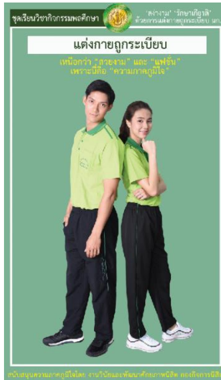
รูปที่ 4 ชุดเครื่องแบบวิชากิจกรรมพลศึกษา

ทั้งนี้ตามระเบียบของมหาวิทยาลัยเกษตรศาสตร์ ประกาศ ณ วันที่ 4 มิถุนายน พ.ศ. 2545 สวจนสิทธิ์ จะไม่ให้บริการแก่นิสิตที่แต่งกายไม่ถูกต้องตามระเบียบ ที่กำหนดดังกล่าวข้างต้น ดังนี้