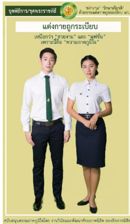
รูปที่ 3 เครื่องแบบนิสิตชุดพิธีการ ชุดพระราชพิธี ที่มา: กองกิจการนิสิต

หมายเหตุ สำหรับนิสิตที่ได้รับมอบหมายให้ปฏิบัติหน้าที่พิเศษในงานพระราชพิธี ให้แต่งกายตามที่อาจารย์ดูแลในงานพิธีนั้นกำหนดให้แต่ง