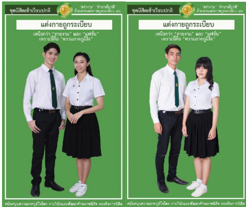
รูปที่ 2 เครื่องแบบนิสิตปกติ ชุดเข้าเรียนปกติ