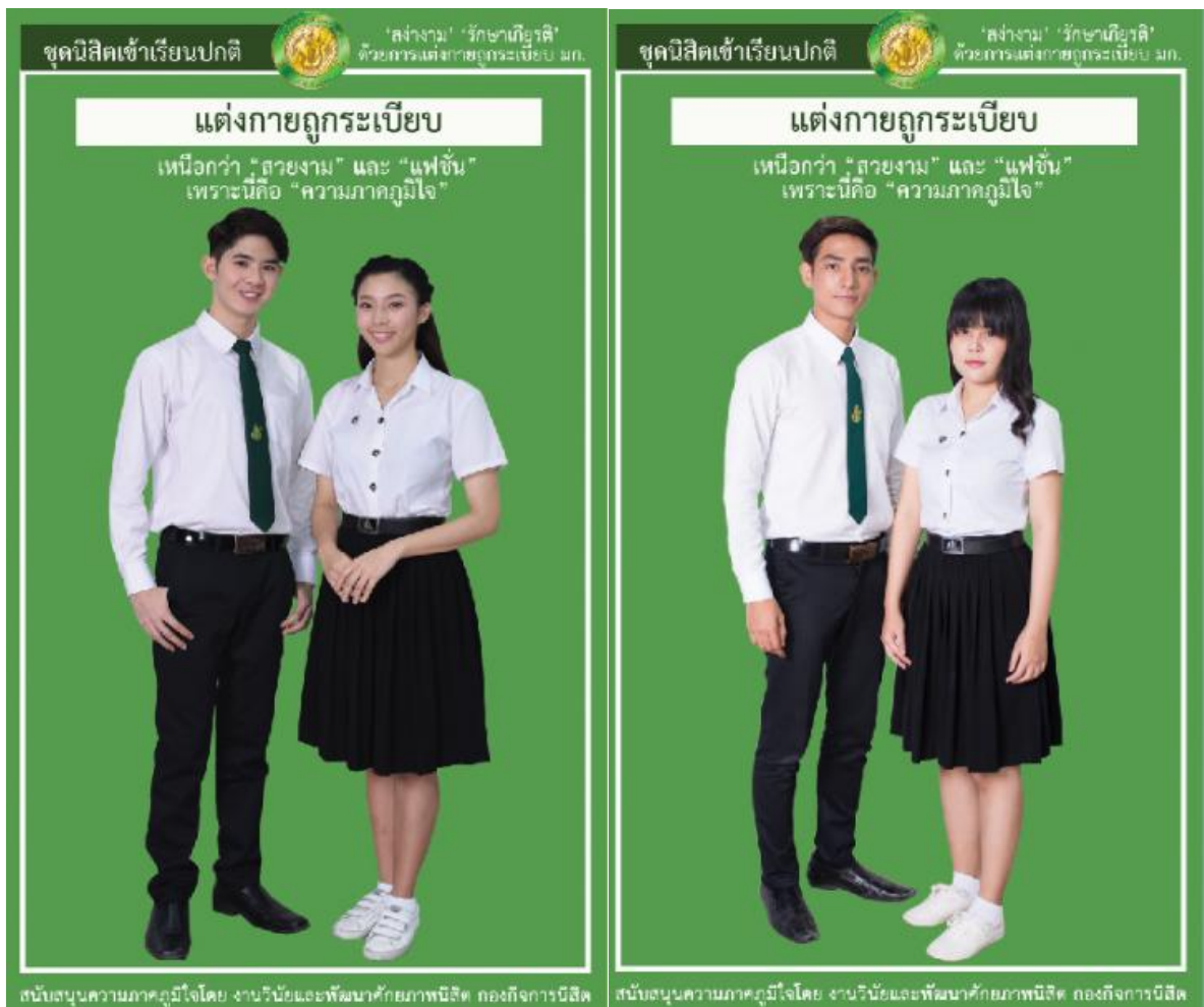
รูปที่ 2 เครื่องแบบนิสิตปกติ ชุดเข้าเรียนปกติ