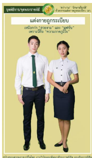
รูปที่ 3 เครื่องแบบนิสิตชุดชุดพิธีการ ชุดพระราชพิธี

หมายเหตุ สำหรับนิสิตที่ได้รับมอบหมายให้ปฏิบัติหน้าที่พิเศษในงานพระราชพิธี ให้แต่งกายตามที่อาจารย์ดูแลในงานพิธีนั้นกำหนดให้แต่ง