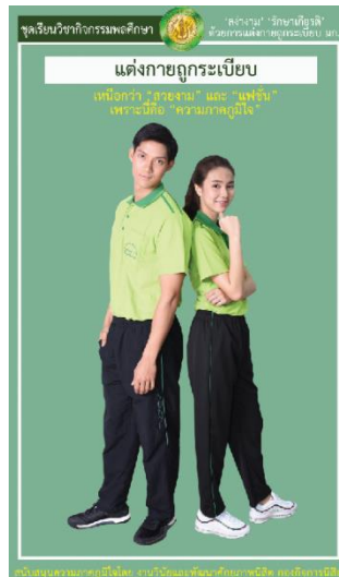
รูปที่ 4 ชุดเครื่องแบบวิชาชีพกรรมการพลศึกษา

ทั้งนี้ตามระเบียบของมหาวิทยาลัยเกษตรศาสตร์ ประกาศ ณ วันที่ 4 มิถุนายน พ.ศ. 2545 สงวนสิทธิ์จะไม่ให้บริการแก่นิสิตที่แต่งกายไม่ถูกต้องตามระเบียบ ที่กำหนดดังกล่าวข้างต้น ดังนี้