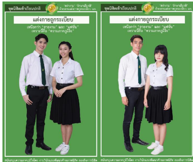
รูปที่ 2 เครื่องแบบนิสิตปกติ ชุดเข้าเรียนปกติ

2) เครื่องแบบนิสิตชุดงานพิธี/ชุดงานพระราชพิธี มีรายละเอียดดังนี้ แสดงดังรูปที่ 3 การแต่งกายในงานพิธี หมายถึง งานพิธีการของคณะและของมหาวิทยาลัย